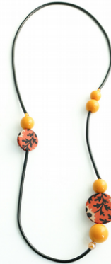
AFRICA Art. 205.6