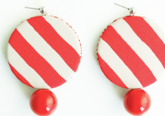
BAGNO 54 Art.211.7