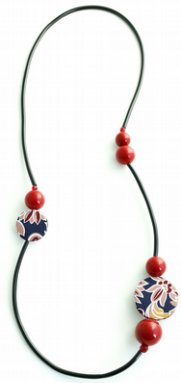
FRUTTI ROSSI Art. 205.5