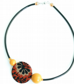
AFRICA Art. 204.6