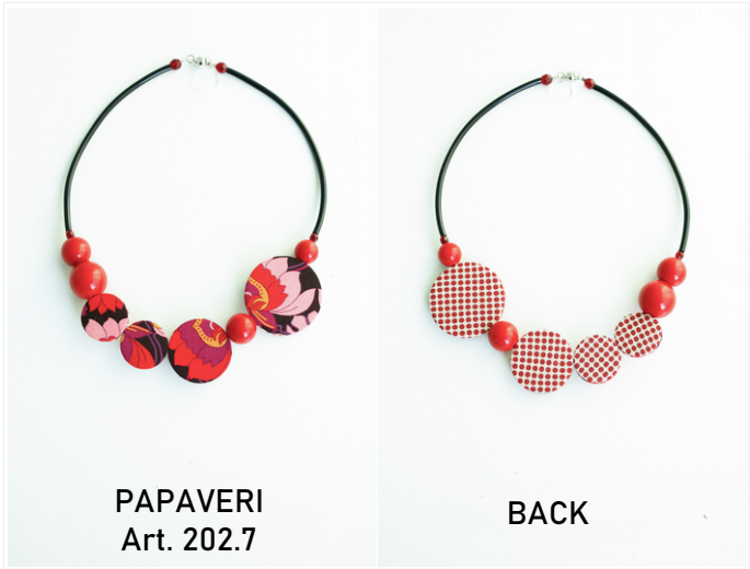
PAPAVERI Art. 202.7