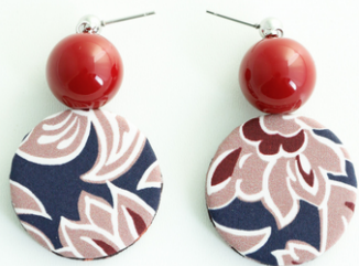
FRUTTI ROSSI Art.212.9