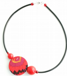
PAPAVERI Art. 204.7