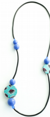
PALM BEACH Art. 205.8