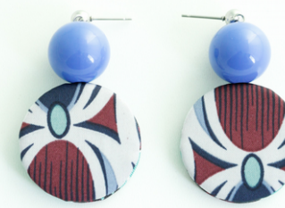
BLU NAVY Art.212.16