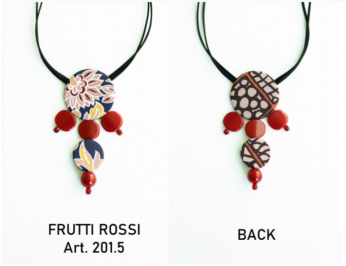
FRUTTI ROSSI Art. 201.5