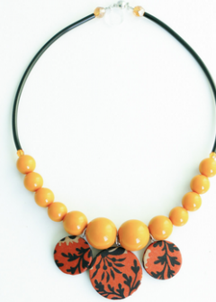
AFRICA Art. 203.6