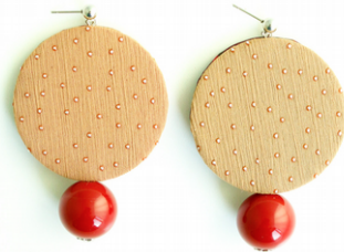
BEIGE GLITTER Art.211.2