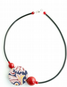
FRUTTI ROSSI Art. 204.5