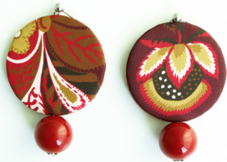
RED WINE Art.211.1

LUNGHEZZA 7 CM - COMPONENTI IN TESSUTO E RESINA DI ALTA QUALITA' – PALLINA IN ACCIAIO PER LOBI FORATI