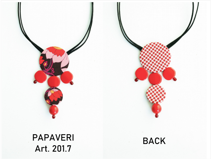
PAPAVERI Art. 201.7