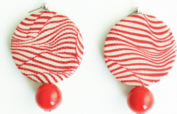
RIGHE SOTTILI Art.211.8