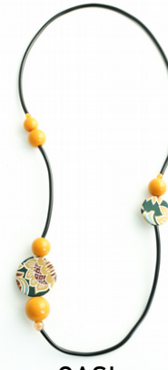
OASI Art. 205.2