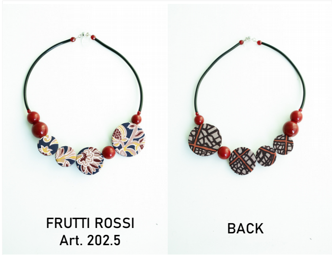
FRUTTI ROSSI Art. 202.5