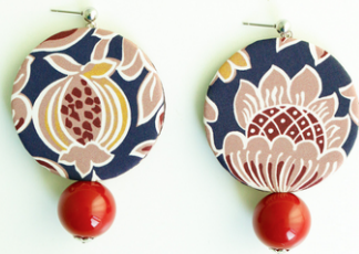
FRUTTI ROSSI Art.211.9