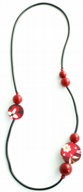
RED WINE Art. 205.1

LUNGHEZZA 90 CM - COMPONENTI IN TESSUTO E RESINA DI ALTA QUALITA' – CHIUSURA CALAMITA