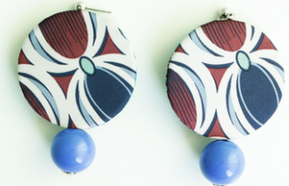
BLU NAVY Art.211.16