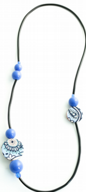
MARE Art. 205.3