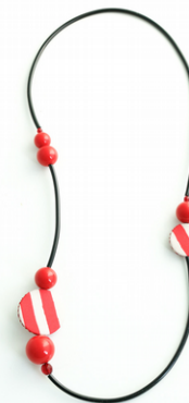
BAGNO 54 Art. 205.4