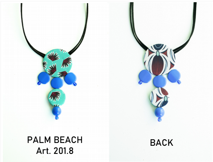
PALM BEACH Art. 201.8