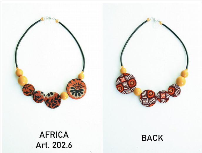
AFRICA Art. 202.6