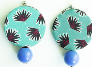
PALM BEACH Art.211.15