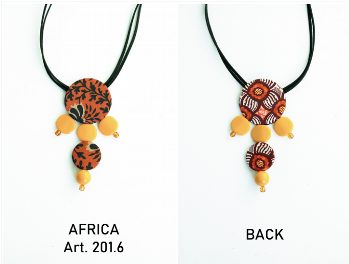
AFRICA Art. 201.6