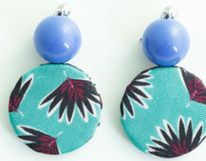
PALM BEACH Art.212.15