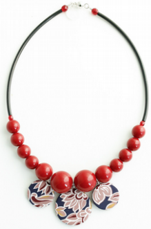
FRUTTI ROSSI Art. 203.5