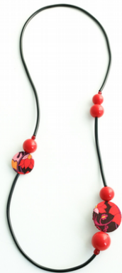
PAPAVERI Art. 205.7