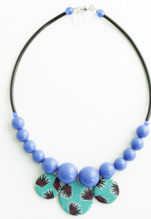
PALM BEACH Art. 203.8