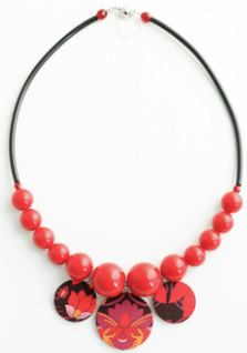
PAPAVERI Art. 203.7