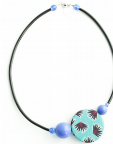
PALM BEACH Art. 204.8