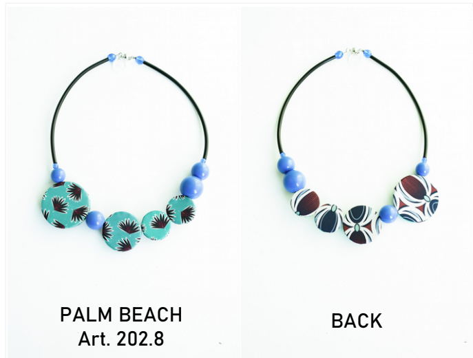
PALM BEACH Art. 202.8